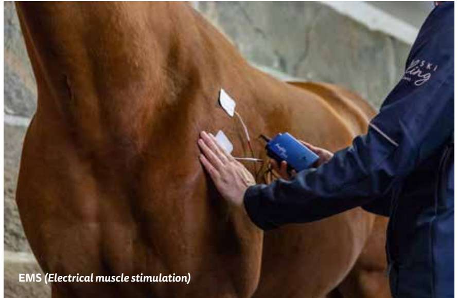
EMS (Electrical muscle stimulation)

Transkutaaninen elektroninen hermostimulaatiohoito, jolla lievitetään kipua. Hoidon vaikutukset perustuvat endorfiinin erittymiseen.