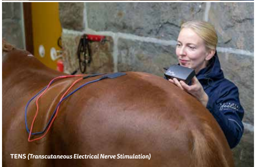
TENS (Transcutaneous Electrical Nerve Stimulation)